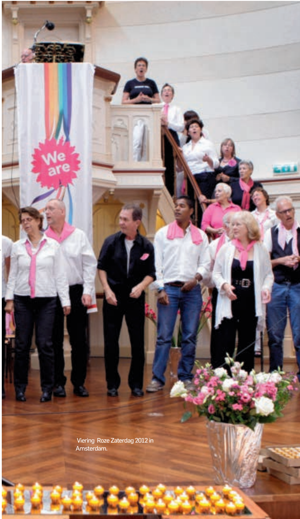
Viering Roze Zaterdag 2012 in Amsterdam.

Roze vieringen, zijn die nog wel nodig? Blijkbaar wel, want de afgelopen vijf jaar kwamen er maar liefst acht bij. Dit weekend vindt voor de 25-ste keer de landelijke kerkdienst op Roze Zaterdag plaats. En in Den Haag gaat in september een heuse internationale 'roze kerk' van start.